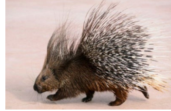
66. முள்ளம்பன்றி (முட்பன்றி)