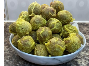
4. பயற்றம் பணியாரம்