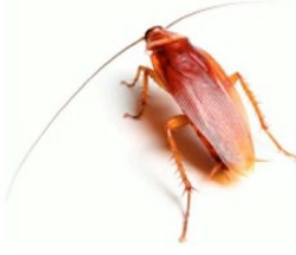
51. கரப்பான் பூச்சி