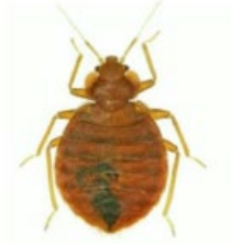
56. மூட்டை பூச்சி