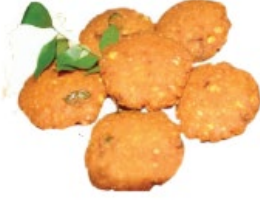
2. கடலை வடை