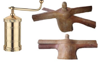
40. இடியப்ப உரல்