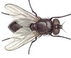
59. இலையான் (ஈ)