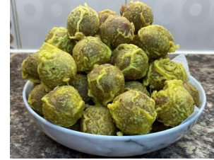
4. பயற்றம் பணியாரம்