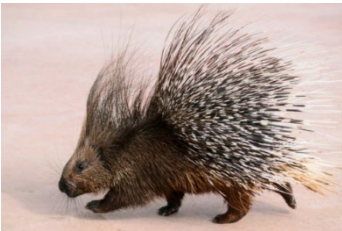
97. முள்ளம்பன்றி (முட்பன்றி)