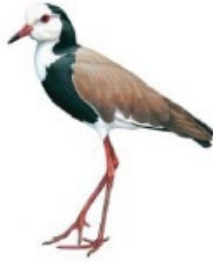
129. ஆட்காட்டிக் குருவி