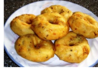
2. உழுந்து வடை