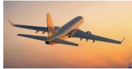
68. விமானம் (வானூர்தி)