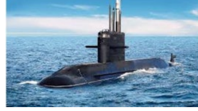
62. நீர்மூழ்கிக் கப்பல்