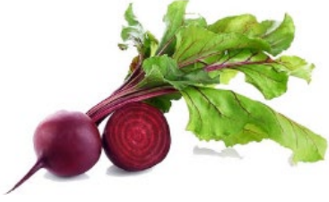
23. செங்கிழங்கு (பீற்றூட்)