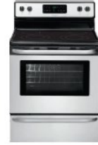
46. மின் அடுப்பு