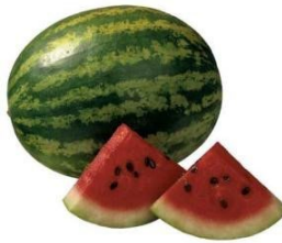
37. வத்தகப்பழம் (தர்ப்பூசணி)