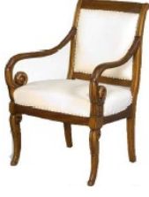
51. கதிரை (நாற்காலி)