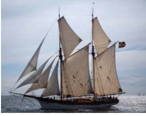
63. பாய்க் கப்பல்