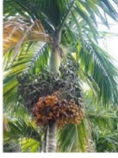
111. கமுகு (பாக்கு மரம்)