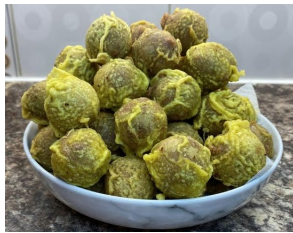
5. பயற்றம் பணியாரம்