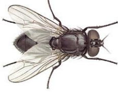
25. இலையான் (ஈ)