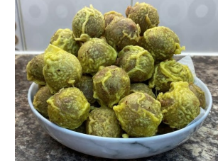
4. பயற்றம் பணியாரம்