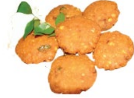
2. கடலை வடை