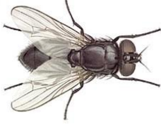
25. இலையான் (ஈ)