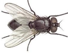
39. இலையான் (ஈ)